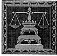
กรมคุ้มครองสิทธิและเสรีภาพ